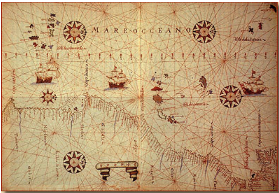
Figura 2. Bulas de Alejandro VI