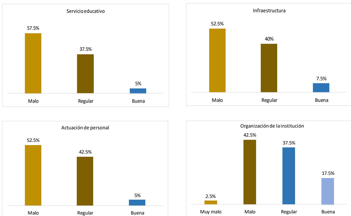
Figura 1: Valoración de las dimensiones del servicio educativo en los estudiantes de la especialidad de educación inicial del “Instituto De Educación Superior Pedagógico Público” – Huaraz.

Como se observa en la figura 1 el 57.50% de los estudiantes de la especialidad de educación inicial del “Instituto De Educación Superior Pedagógico Público” de Huaraz, considera que el servicio educativo brindado por la institución es mala, mientras que el 37.5% la considera regular, y el 2% como buena.